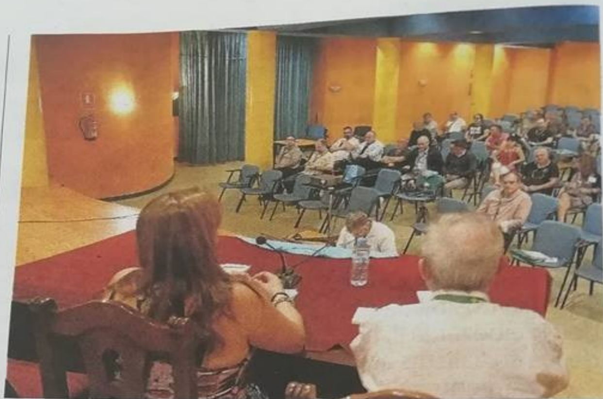
Seminario sobre violencia sexual en La Felguera.