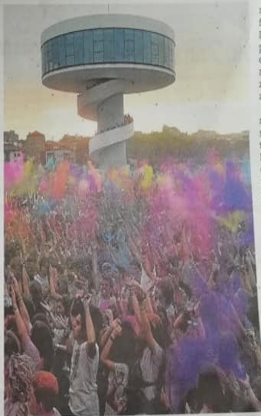
Una edición anterior de la fiesta en el Niemeyer.

nes, los creadores e impulsores de esta fiesta además de organizar el festival Las Músicas, recordaron que «siempre tenemos en cuenta la seguridad en todos nuestros eventos, como venimos haciendo desde que se organizó la primera Holi Party hace cinco años».