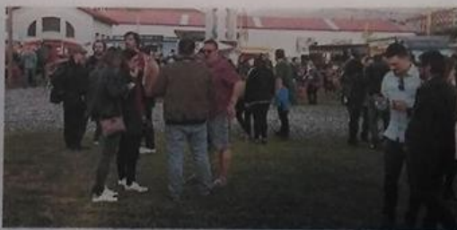
Público en el Festival de la Cerveza del año pasado.