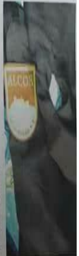
Uniforme roto. (E. F.)

Las conclusiones del informe llegan después de requerir a Alcor en octubre de información sobre los cuadrantes mensuales de vigilante desde mayo de 2017, los justificantes de entrega de ropa de trabajo y la documentación relativa a los coches de empresa.