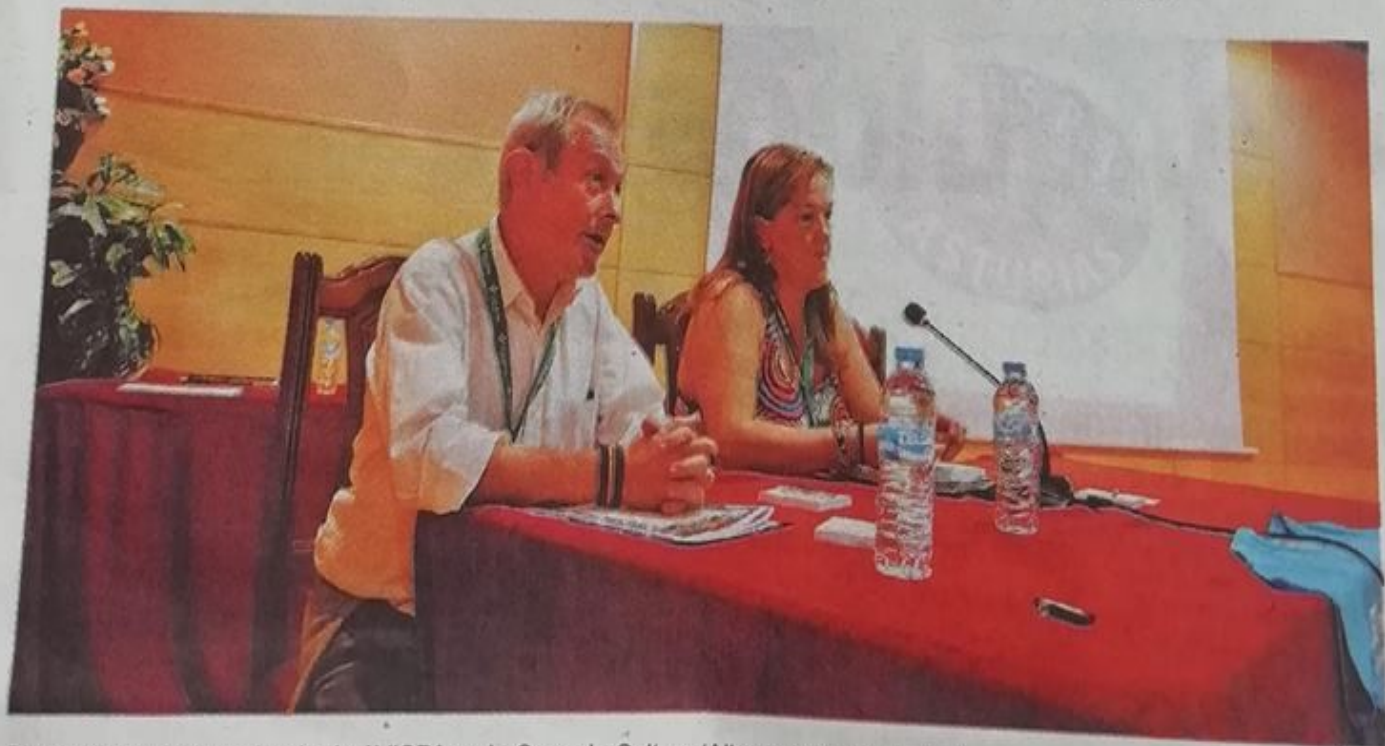
Presentación del seminario de AVISPA en la Casa de Cultura 'Alberto Vega' de La Felguera.

El seminario fue impartido por abogados, psicólogos, policías y personal sanitario con los que se compartieron experiencias, situaciones reales y muchas dudas sobre la forma de actuar. Una de las conclusiones de este primer curso, que con toda probabilidad se impartirá próximamente en Soria, es la implicación de la mayor parte de colectivos que vayan a tomar parte de una manera u de otra en el evento a desarrollar.