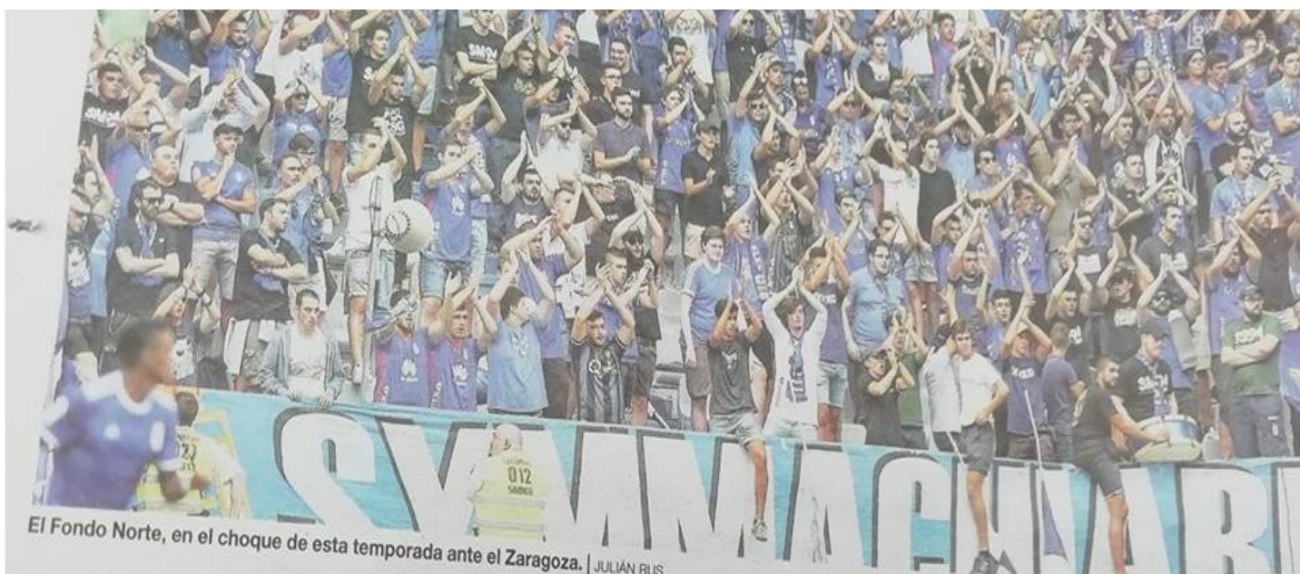
El Fondo Norte, en el choque de esta temporada ante el Zaragoza.

"Es injusto: Symmachiari no es un grupo violento"