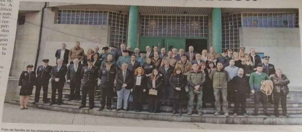
Foto de familia de los premiados por la Asociación de Vigilantes de Seguridad Privada del Principado de Asturias (AVISPA)